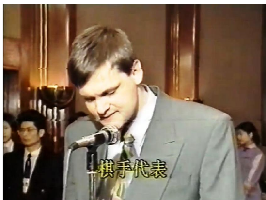
乌韦作为棋手代表在 1993 年北京世锦赛上发言