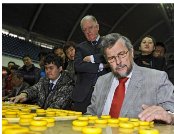
耐格勒博士在清华大学应众表演 (观看者为世界体育总会主席维尔布鲁根)

最新消息: 德国象棋协会将受托在汉堡孔子学院承办 2014 年“韩信杯”象棋国际名人赛!