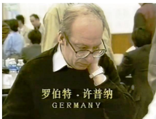
罗伯特·许普纳博士，1980 年国际象棋世界排名第三

当德国著名的国际象棋特级大师罗伯特·许普纳博士与柏林的中国象棋组织取得联系的时候，德国公众的注意力被吸引了。他参加了一系列中国象棋代表团（由胡荣华、钱洪发和许波组成）的活动为今后的一些象棋赛事获得一些经验和实际操练。他参加了 1987 年在巴黎举行的欧洲象棋锦标赛（获得第 6 名），在伦敦举行的欧洲象棋锦标赛（第 2 名），1987 年在四川成都举行的第三届“七星杯”象棋国际邀请赛（第 24 名），以及 1993 年在北京举行的世界象棋锦标赛（第 36 名，最佳非华越裔棋手！）。